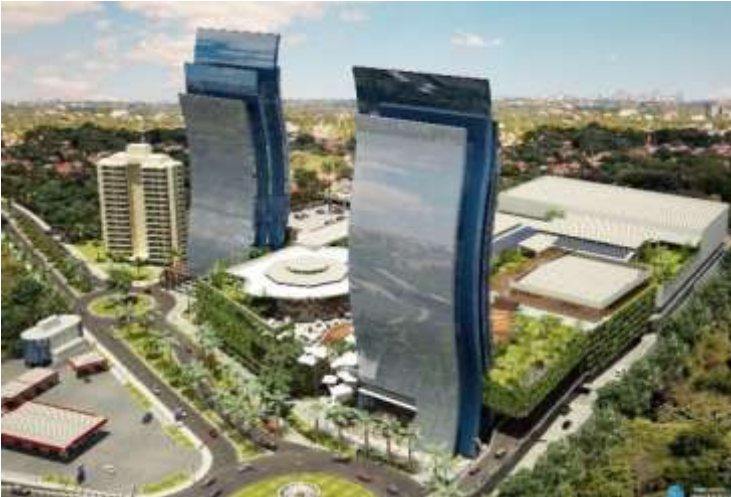
Las dos torres de oficinas tendrán 23 pisos, además de shopping, salón de eventos, restaurantes y estacionamientos, según el proyecto.