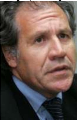
Luis Almagro, canciller del Uruguay.

Venezuela asumirá presidencia del Mercosur a espaldas del Paraguay -- El canciller del Uruguay Luis Almagro anunció ayer que la Cumbre de Mercosur prevista para este 28 de junio se hará el 12 de julio en Montevideo. En la reunión de presidentes, el mandatario de Venezuela, Nicolás Maduro, asumirá la titularidad pro t mpore del bloque ante la suspensión de Paraguay. El Congreso paraguayo había rechazado el ingreso del país caribeño al Mercosur.